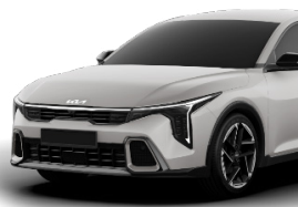
Snow White Pearl (SWP) metallic (pearleffekt)