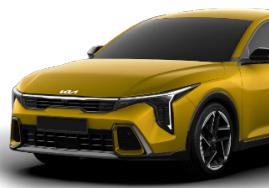
Sparkling Yellow (DY2) metallic