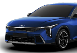
Azure Blue (B2R) metallic