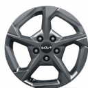
16" aluminiumfälg (Action)