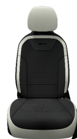
Svart interiör med svart/vit konstläder. (GT Line)