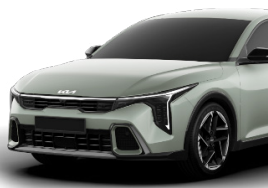
Morning Haze (DM4) solid