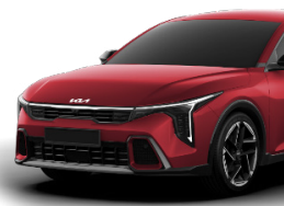
Fiery Red (R4R) metallic