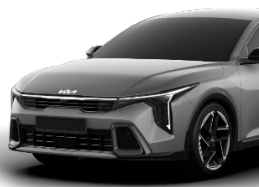
Steel Gray (KLG) metallic