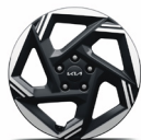
17" aluminiumfälg (Advance)