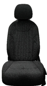
Svart interiör med svart tygklädsel. (Action)