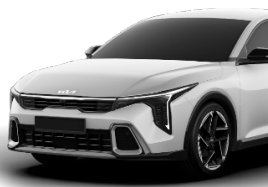
Clear White (UD) solid