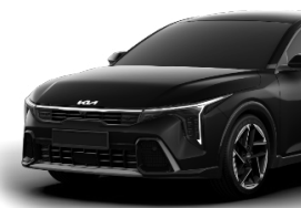
Aurora Black Pearl (ABP) metallic (pearleffekt)

Kia Sweden AB Kanalvägen 10A 194 61 Upplands Väsby Sverige Tfn: 08 - 400 443 00 www.kia.com