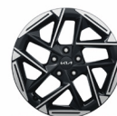
18" aluminiumfälg (GT Line)