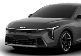
Interstellar Gray (AG9) metallic