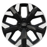
19" aluminiumfälg (Action & Advance)