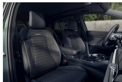
Mörk klädsel i mockaimitation samt konstläder, (GT Line)