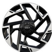
19" aluminiumfälg (GT Line)