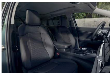
Mörk delläderklädsel (konstläder), (Advance)