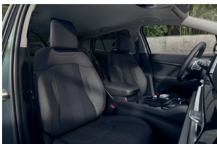
Mörk Tygklädsel, (Action)