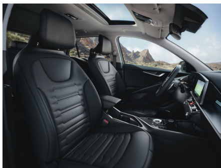
Konstläder i svart (Advance SE)