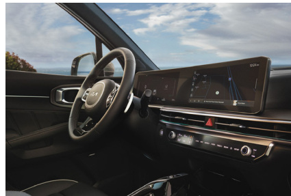
12.3" + 12.3" skärmar (Advance & Advance Plus)