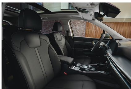
Svart läderklädsel (Advance & Advance Plus)